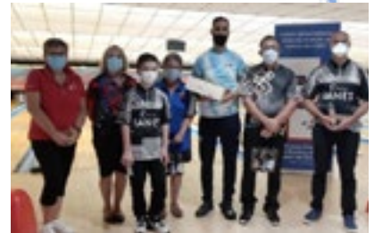
Les finalistes avec le jeune minime et les responsables CD45